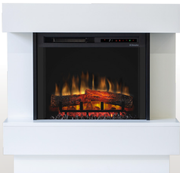
Avalone white 111168 / 5011139123800